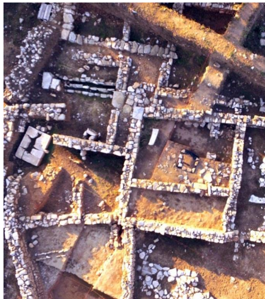
Ναός _ Αυλή Βάθρων