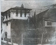
Το αρχοντικό του Χατζηγιώργη Μεταξά, κτισμένο το 1820, όπου αποφεύχθηκε η κήρυξη της επανάστασης τον Ιούνιο του 1821. Φωτογραφική επίσκεψη Ιταλιανού Γαβριέλη

Η Θάσος το 1821 ζούσε κάτω από ένα καθεστώς ευνοϊκών προνομίων, που τους παραχώρησε ο νέος κυριάρχης τους Μεχμέτ Αλής. Οι κάτοικοι του νησιού κάτω από μια σκιώδη τουρκοαγυπτική εξουσία βρισκόταν την ευκαιρία να αποκρυσταλλώσουν μια μορφή ιδιότυπου κοινοτικού πολιτεύματος, που προκάλούσε τον θαυμασμό του κάθε επισκέπτη. Παράλληλα με την τουρκική και αγυπτιακή εξουσία αναπτύσσεται στη Θάσο και μια ελληνική κοινοτική εξουσία.